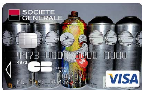
1er prix Catégorie grand public

Les 2 gagnants du premier prix dans chaque catégorie remportent un week-end à Berlin ou Londres, deux grandes capitales Européennes du Street Art, et leurs cartes feront partie du catalogue de cartes Collection 2013.