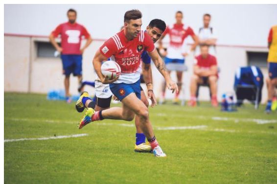
Jean-Pascal Barraque

CONTACT PRESSE SOCIÉTÉ GÉNÉRALE - fr-relations-medias@socgen.com - +33(0)1 42 14 67 02