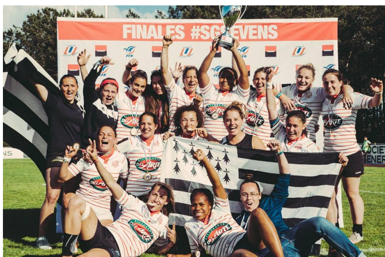
L'Université Rennes 2, vainqueurs du SGSevens 2017, catégorie Elite féminines

Agrocampus Ouest Centrale Supélec EGSI La Rochelle ICAM Lille INP Bordeaux INP Grenoble INP Toulouse INSA Lyon (1) INSA Lyon (2) INSA Toulouse Université Paris Dauphine Université Technologie Troyes