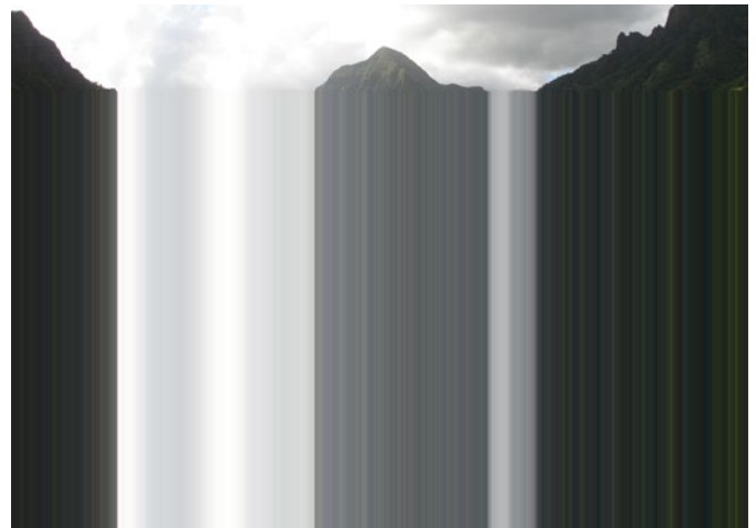
Marie Maillard, Water I , 2006 Diasec, 114 x 160 cm

Saint-Denis, Evry, Mantes-la-Jolie, Val d'Europe