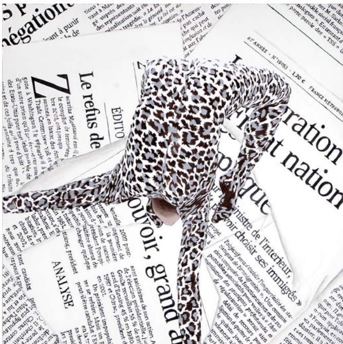
Agnès Thurnauer, Biotope (immigration) , 2006 acrylique sur toile, 155 x 150 cm