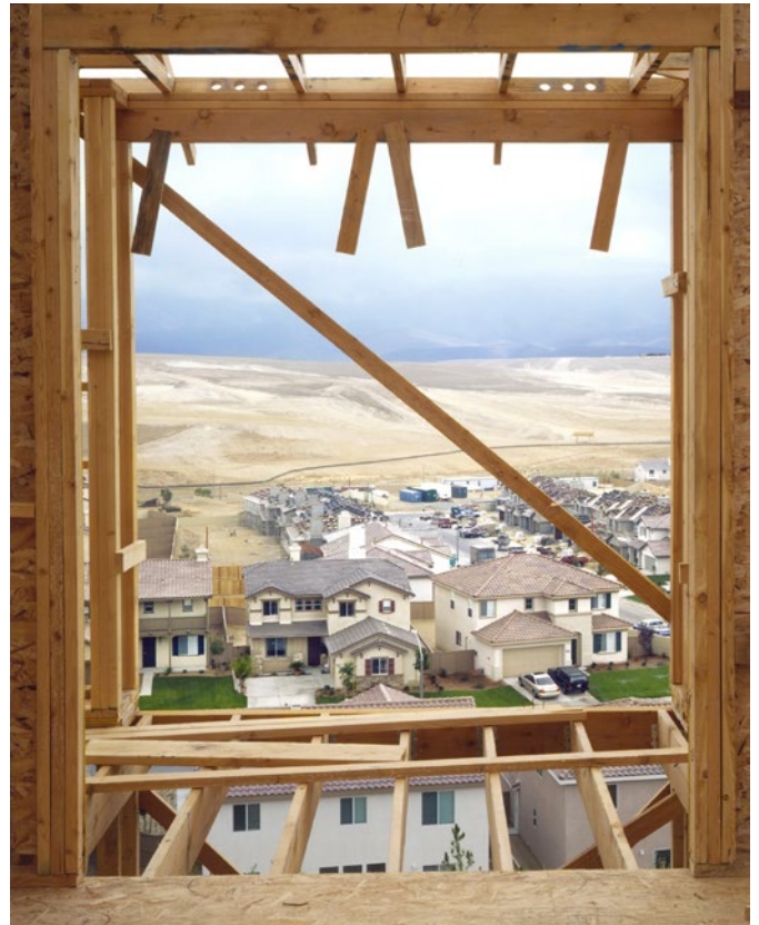
Stéphane Couturier, San Diego – Fenêtre East Lake Greens, 2002 C-print sur diasec, 245 x 190 cm