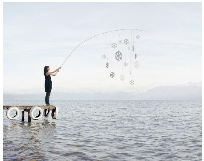
Loan Nguyen, Neige , 2008, Ink-jet print, 120 x 160 cm