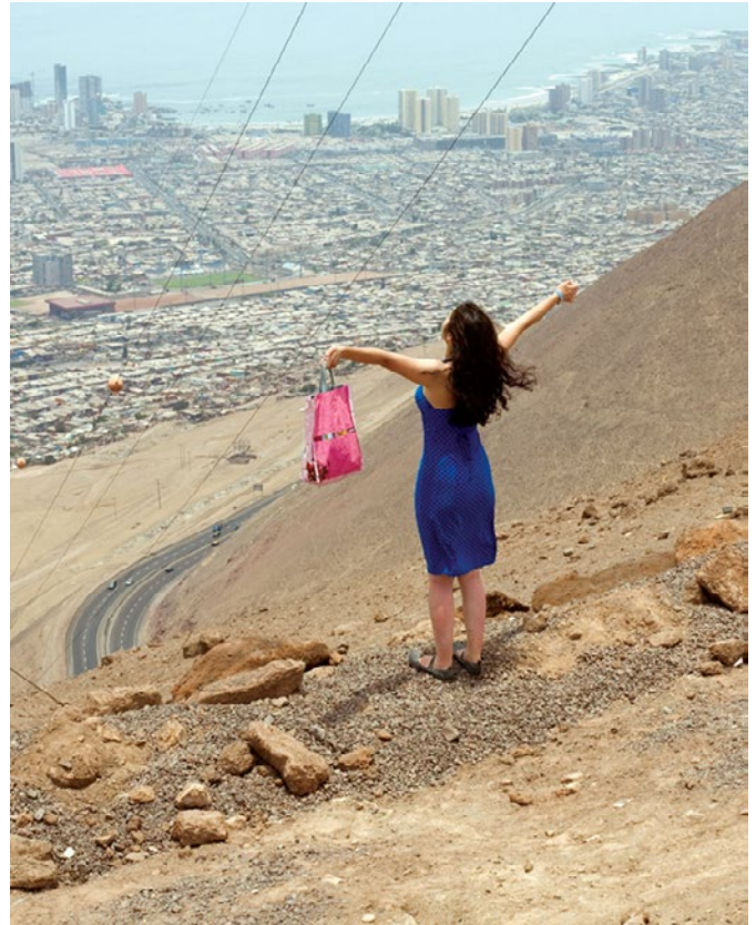
Jordi Colomer, Le sac rose , 2008 Tirage lightjet sur papier argentique, 140 x 115 cm

La Défense, 1 er étage des Tours Alicante et Chassagne